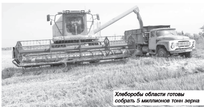
Хлеборобы области готовы собрать 5 миллионов тонн зерна

«Спасибо нашим труженикам за такой настрой и серьезные подходы к поставленным задачам. Уверен, что вместе с хозяевами-лидерами, которые есть на территории каждого района, вам удастся добиться высоких результатов в уборке урожая».