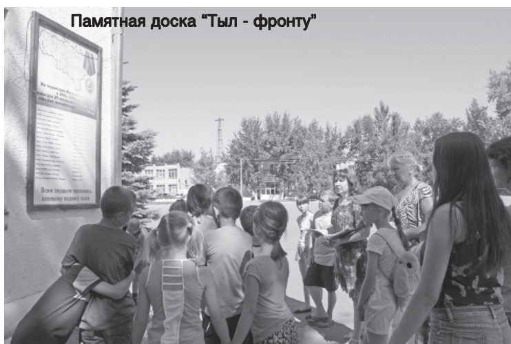
Памятная доска «Тыл - фронту»

Еще одно любимое место отдыха жителей и гостей р.п. Мокроус - парк. В следующем году он отметит свой юбилей