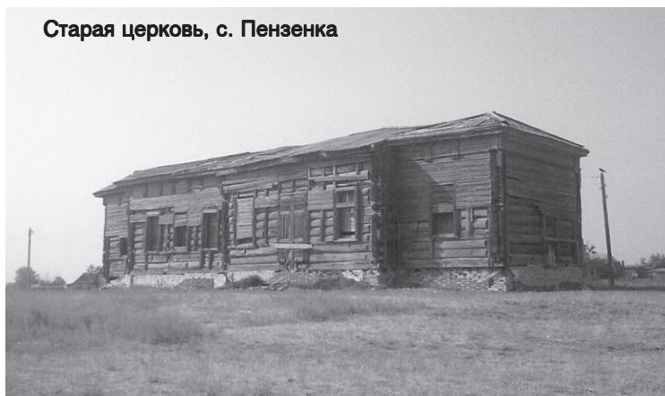
Старая церковь, с. Пензенка

роуса как кантонного (районного) центра архитектурный план утверждался в столице АССР НП - г. Энгельс. Озеленение главной улицы началось в начале 60-х годов 20 века.