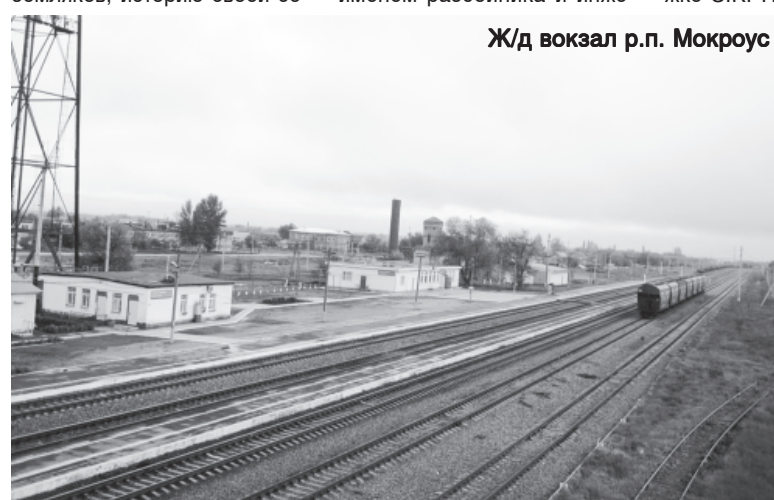
Ж/д вокзал р.п. Мокроус