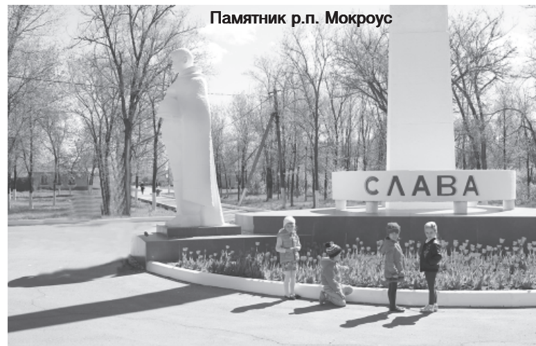
Памятник р.п. Мокроус

(кстати, Борисоглебовка имела и другое название - Лихомановка), Долина (Шенталь) - храм Архангела Михаила в с. Борисоглебовка. Известны имена наших героев войны и