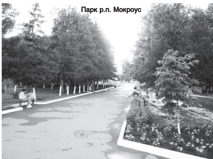
Парк р.п. Мокроус

Самыми крупными населёнными пунктами были Борисоглебовка с Новоборисоглебовкой (сейчас это одно село) - 3351 человек,