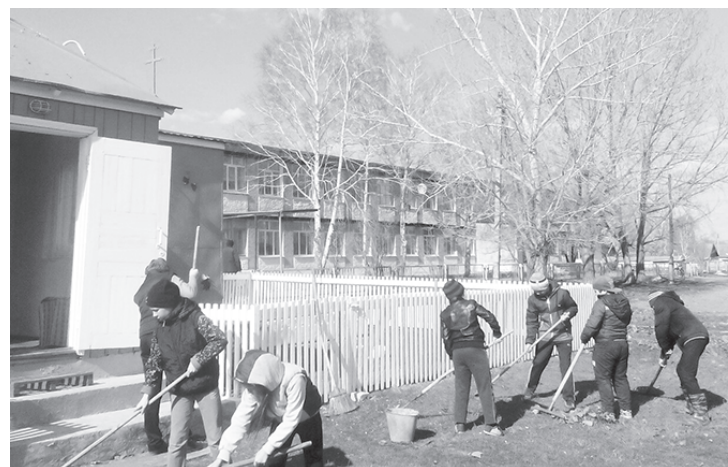
Мы убрали сухую траву около

памятника и храма, а в детском саду покрасили забор, - рассказали юные волонтеры. – Впереди большой и значимый праздник - День Победы, и наша задача - участвовать в шестии Бессмертного полка, помогать участникам войны и труженикам тыла.